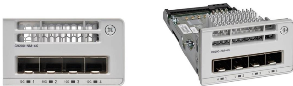
图 2. 思科 Catalyst 9200 系列交换机网络模块

思科 Catalyst 9200 系列交换机配备模块化或非模块化上行链路，如表 1 所示。模块化 SKU 的现场可更换网络模块支持从 1G 无中断迁移到 10G 及更高规格，因此可为您的基础设施投资提供投资保护。在购买交换机时，您可以选择表 2 中列出的网络模块。