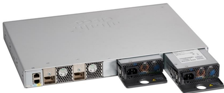
图 3. 思科 Catalyst 9200 系列交换机双冗余电源