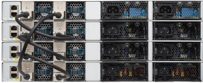
图 4. 思科 Catalyst 9200 系列交换机堆叠设备